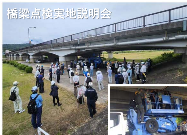
橋梁点検実地説明会