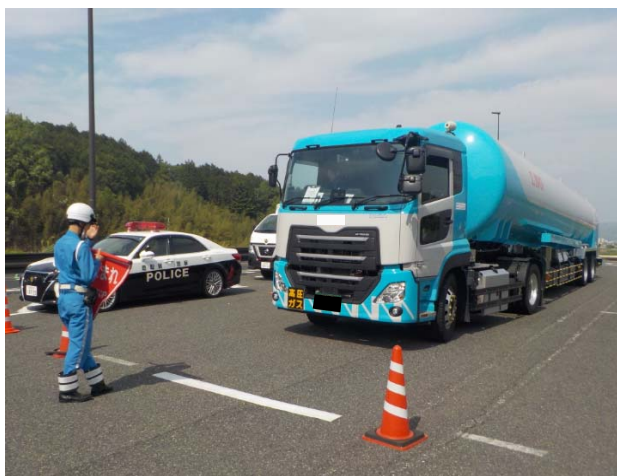
鳥取県警察の協力による車両の引込