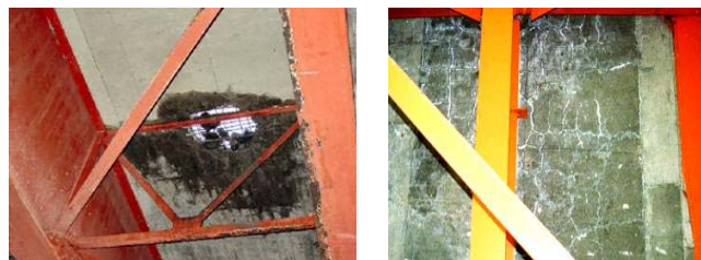
橋の裏面の様子(床版)

道路が傷められる原因のひとつとして、無許可や通行条件違反で通行することがあげられます。このルール違反の車両が、非常に大きな比率を占めている状況にあり、道路や橋に与える影響は多大です。特に、重量超過の車両が道路に与える影響は、非常に大きなものがあります。