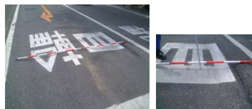
舗装のわだち掘れ