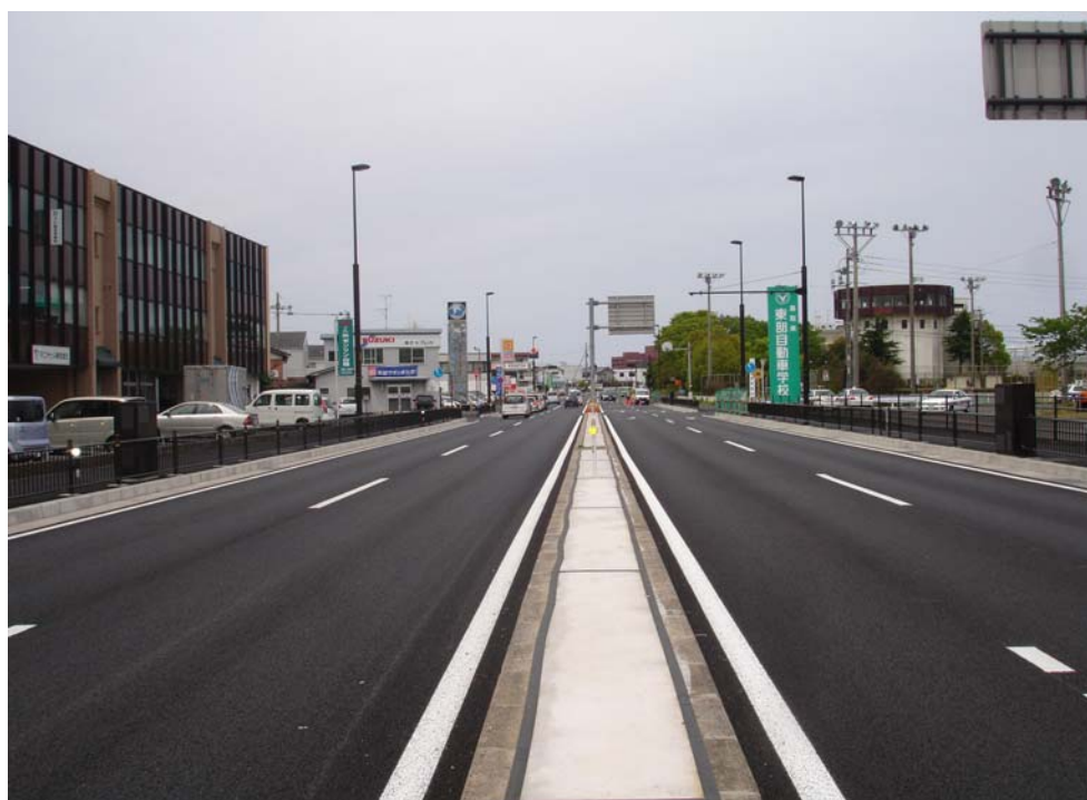
整備前の状況（鳥取市秋里）