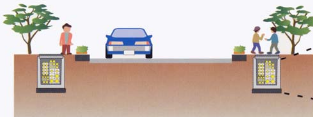
電線共同溝 (C·C·BOX) のイメージ図