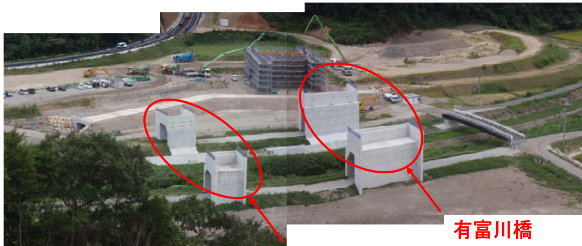
有富川橋ランプ橋