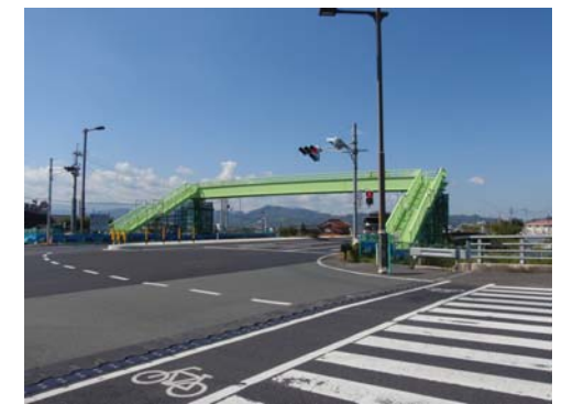
現地写真 横断歩道橋設置後 (H22.10.01現在)