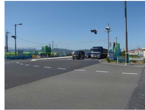
現地写真 横断歩道橋設置前

完成後は、米里小学校の通学路にも指定され、 高架橋下通路 を通ることなく、より安全に通学できるようになります。