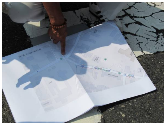
地域防災マップの素案