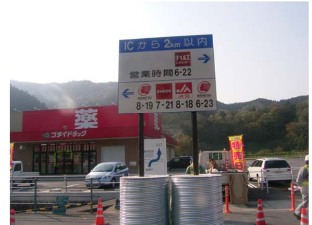
⑤国道53号(智頭IC交差点)での案内表示