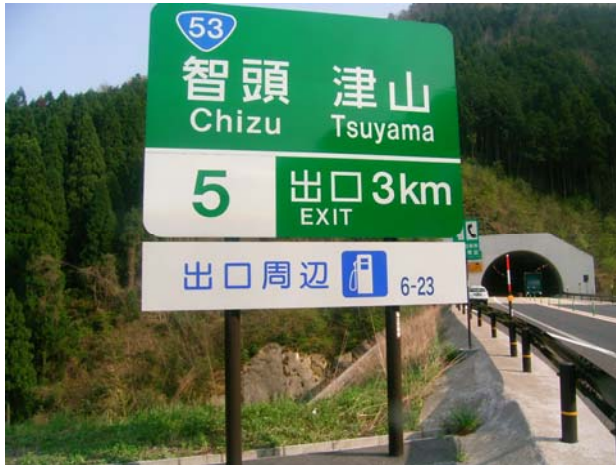
①鳥取道本線上の案内表示 (鳥取方面行き 智頭IC3km手前付近)