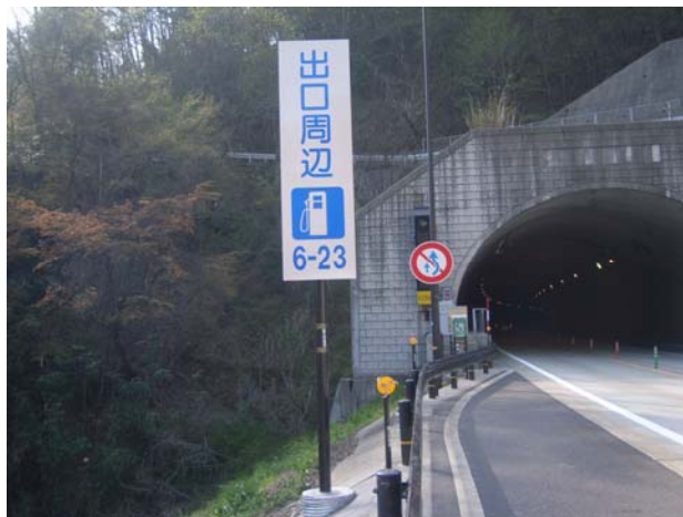
③鳥取道本線上の案内表示 (兵庫方面行き 智頭IC3km手前付近)