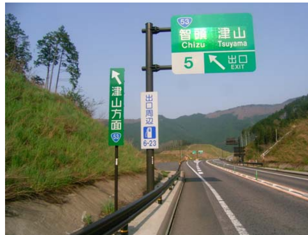
②鳥取道本線上の案内表示 (鳥取方面行き 智頭IC出口付近)