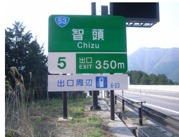
④鳥取道本線上の案内表示 (兵庫方面行き 智頭IC出口付近)