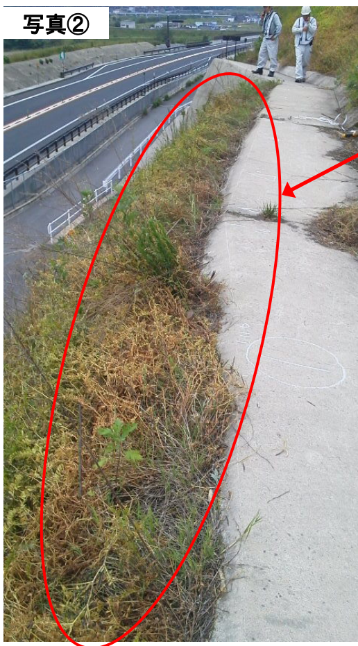
法面の変状(植生のずれ)