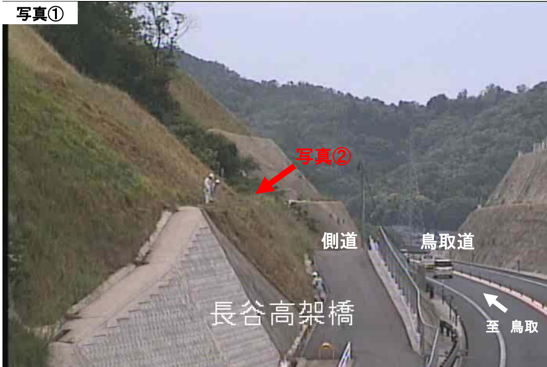
写真① 変状法面 遠景(鳥取市倭文 しとり 地内 鳥取自動車道側道部 法面)