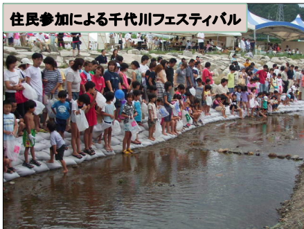
住民参加による千代川フェスティバル