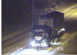
H24.1.24 国道9号 中山登坂