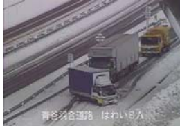
H23.12.23 山陰道道の駅はわいらランプ