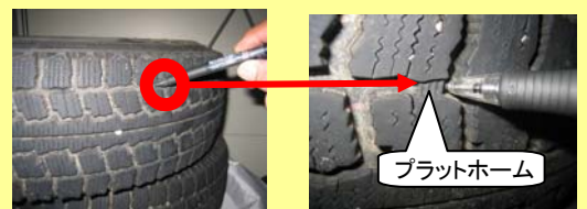
プラットホームまで達すると50%摩耗

この中で、全車輪にスノータイヤ(接地面の突出部が50%以上摩耗していないものに限る。)を装着し、又は駆動輪にタイヤチェーンを取り付ける等自動車のすべり止めに効果のある措置を講ずることとなっております。(第9条の22 第1号) 冬用タイヤの摩耗状況確認をお願いします。