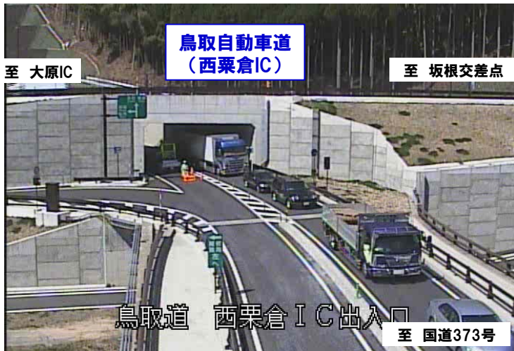
▲ 迂回のため、西粟倉ICで国道373号線に下りる車両

平成26年4月15日には、故障車により、西粟倉IC～坂根交差点間の下り線(鳥取方向)が、1時間弱通行止めになりました。 この通行止めで約600mの渋滞が発生しました。