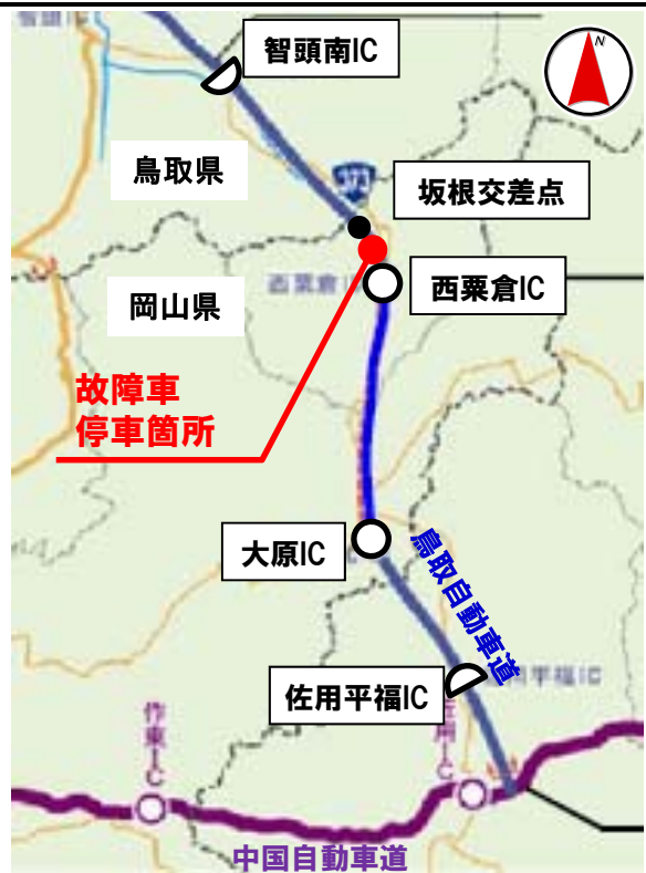
▲故障車(4/15発生)の発生位置図