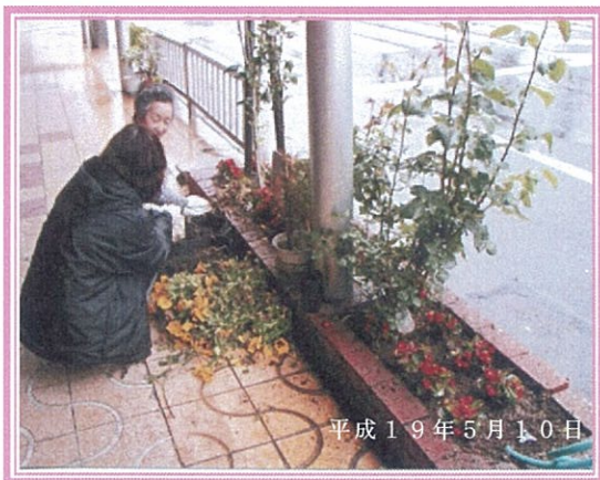
心とお花壇 ベゴニアを植えていただきました。

★★★★★ボランティアロード本通りさんも53号線沿いに花植をして頂きました。★★★★★