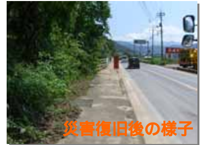
災害復旧後の様子