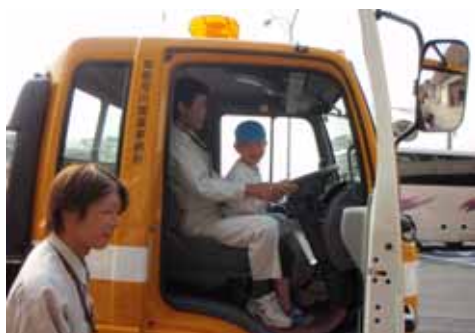
凍結防止剤散布車に乗って“ニコッ”