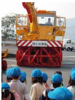
ロータリー除雪車を見学