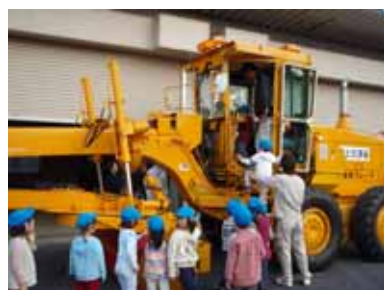
除雪グレーダに試乗 仲良く順番まちです