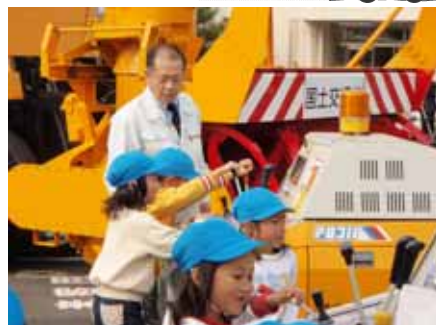
動かな～?(歩道除雪機)