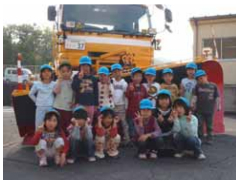
除雪トラックの前で記念撮影