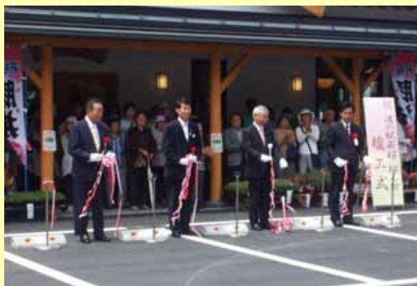
開所式テープカット

この「道の駅」の中には刃物や木工品等の地元特産物や農産物の販売所、「豚丼」や「さば天うどん」など地元産の食材を使った料理が味わえる食堂のほか、トイレ、休憩室、情報コーナーがあります。情報コーナーでは国道のモニター映像を利用した道路情報を見ることができます。