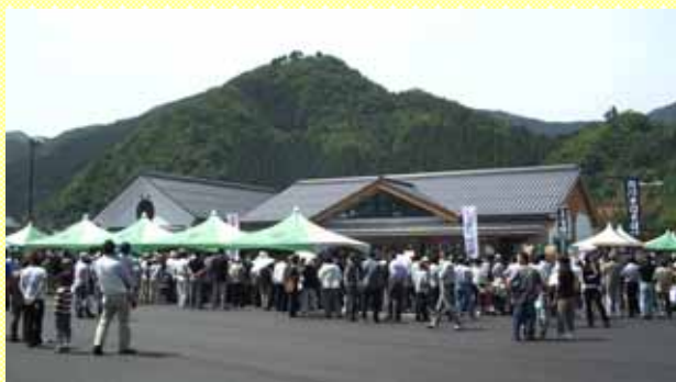
大勢の買い物客でにぎわう道の駅