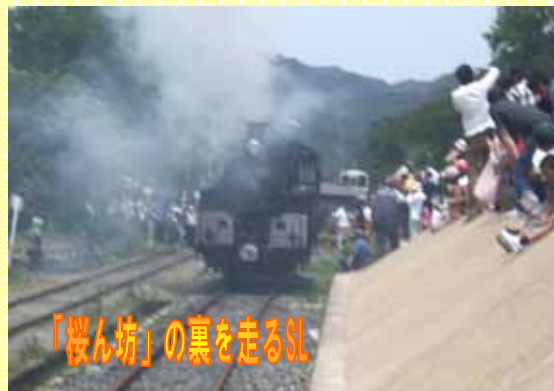
「桜ん坊」の裏を走るSL