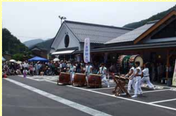
開店を祝う氷ノ山樹氷太鼓