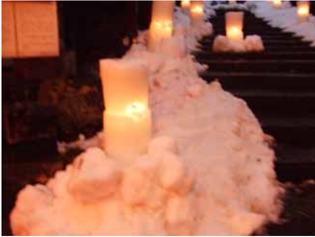
1月31日(土)智頭町で行われた雪祭りに行ってきました。あいにくの雨模様でしたが、雪灯ろうに明かりが灯されると辺りは幻想的な景色に つつまれました。

1月10日鳥取全県に大雪警報が発令され県下全域大雪となりました。寒気は暫く居座り肌寒い天気が続いていきます。周期的に週末になるとやや強い寒気が入り雪を降らせています。山沿いでは、気温が低いため一度降つたらなかなか消えません。例年旧暦の大寒を挟む1月半ばから2月末頃が一番寒く雪も多い時期です。暖かい日が続いてもまだまだ油断大敵です。今年は1月にかかなりの降雪がありました。1月の過去4年間の戸倉峠の積雪深は下図のとおりです。