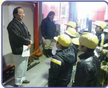
熱心に話を聞く児童達