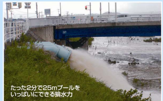
たった2分で25mプールを いっぱいにする排水力