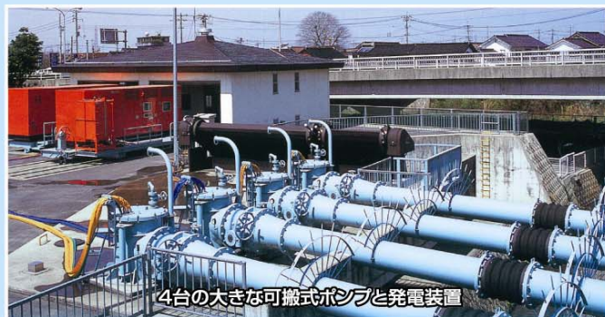
4台の大きな可搬式ポンプと発電装置

古海地区は鳥取市内でも低い場所にあり、台風や大雨で浸水の被害にあってきました。古海排水機場は河川の水をポンプで吸い出すことで、被害を最小限に食い止めることができるよう平成9年に造られました。