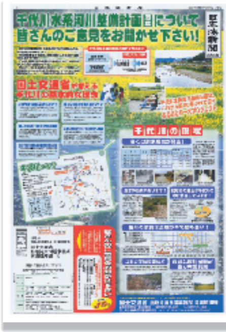
原案概要書(日本海新聞広告:平成19年1月22日)