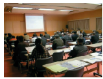
地元説明会の模様(鳥取会場)