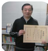
富桑地区防災・ 防犯連絡協議会