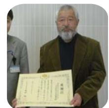
大正地区 防災連絡協議会