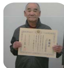
明徳地区 防災連絡協議会