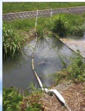
H22.7月 有富川水質事故