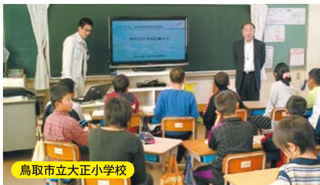
鳥取市立大正小学校

今年度は鳥取市立大正小学校、鳥取市明德地区、大正地区、富桑地区において防災学習会を実施しました。千代川での自然災害の実例紹介や、クロスロードゲームを利用した意見交換を行い、災害対応力を養ってもらうよい機会となりました。