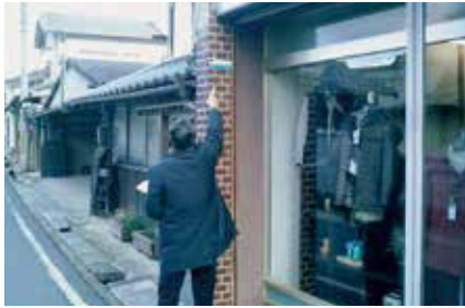
久崎地区の痕跡水位(軒下浸水)

12月20日、行政機関の水災害に対する防災・減災意識の向上を目的として佐用町(兵庫県)との意見交換会を実施しました。