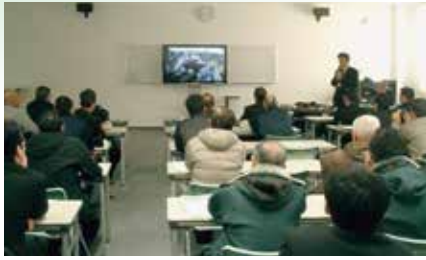
佐用町職員による被災体験談