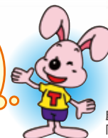
殿ダムイメージキャラクター 「とのまるくん」