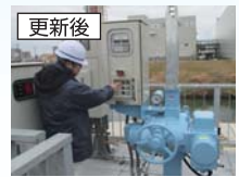
更新後 ボタンで操作できるようになりました