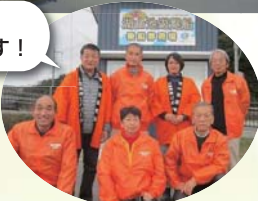
湖山池遊覧船 語り部のみなさん

問合せ先 ☎ 0857-30-5078 (湖山池遊覧船) http://www.yourun1000.com/