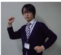
防災サインの一例「逃げろ」