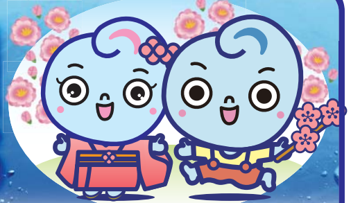
ウェーブちゃん 清流くん