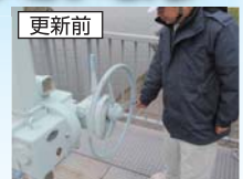
更新前 手でまわっていました