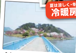
青島公園のふもとは、桜が満開 船からの眺めもまた格別ですよ!