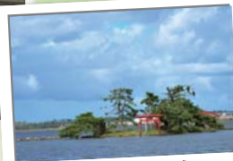
弁天堂の赤い鳥居のある猫島 猫にまつわる伝説が残されているよ。