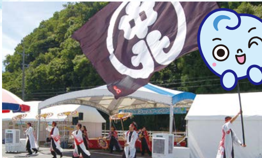
郡家・中北連踊り