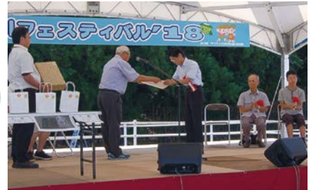
千代川フォトコンテスト表彰式