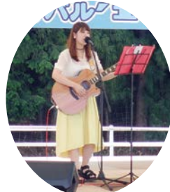
ちゃんゆりコンサート

《申込み・問合せ先》殿ダム因幡万葉湖ウォーキング大会実行委員会 TEL0857-58-0570 FAX0857-58-0571