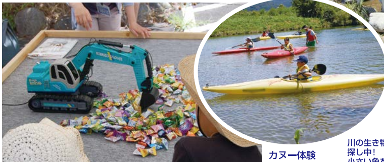
建設機械ラジコンであめ玉つかみ