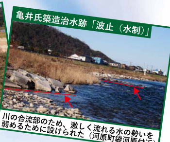
亀井氏築造治水跡「波止(水制)」