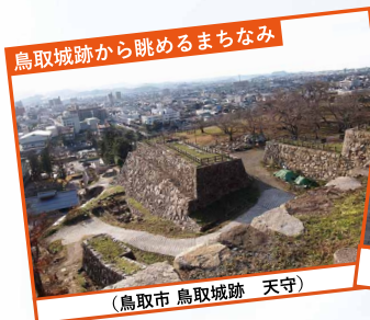
鳥取城跡から眺めるまちなみ