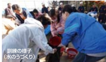
訓練の様子 (水のうづくり)

11月21日(日)、大正地区公民館及び大正小学校校庭で水防訓練が行われました。土嚢作りや避難方法の実地訓練に加え、鳥取河川国道事務所からは、洪水に備えることの重要性について講演を行いました。