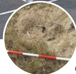
◀点検結果の一部 (堤防法面に小動物の穴あり)