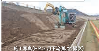
施工写真(R2.3月下流側より撮影)