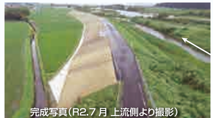
完成写真(R2.7月上流側より撮影)