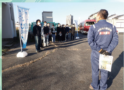
フィールドワーク