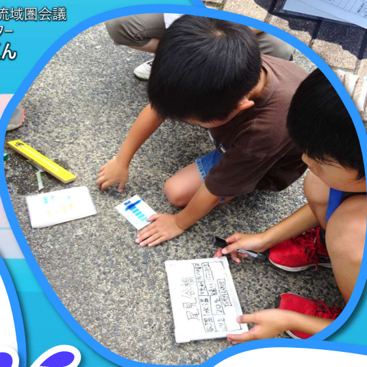
千代川流域圏会議 キャラクター 清流くん