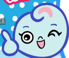
千代川流域圏会議 キャラクター ウェーブちゃん