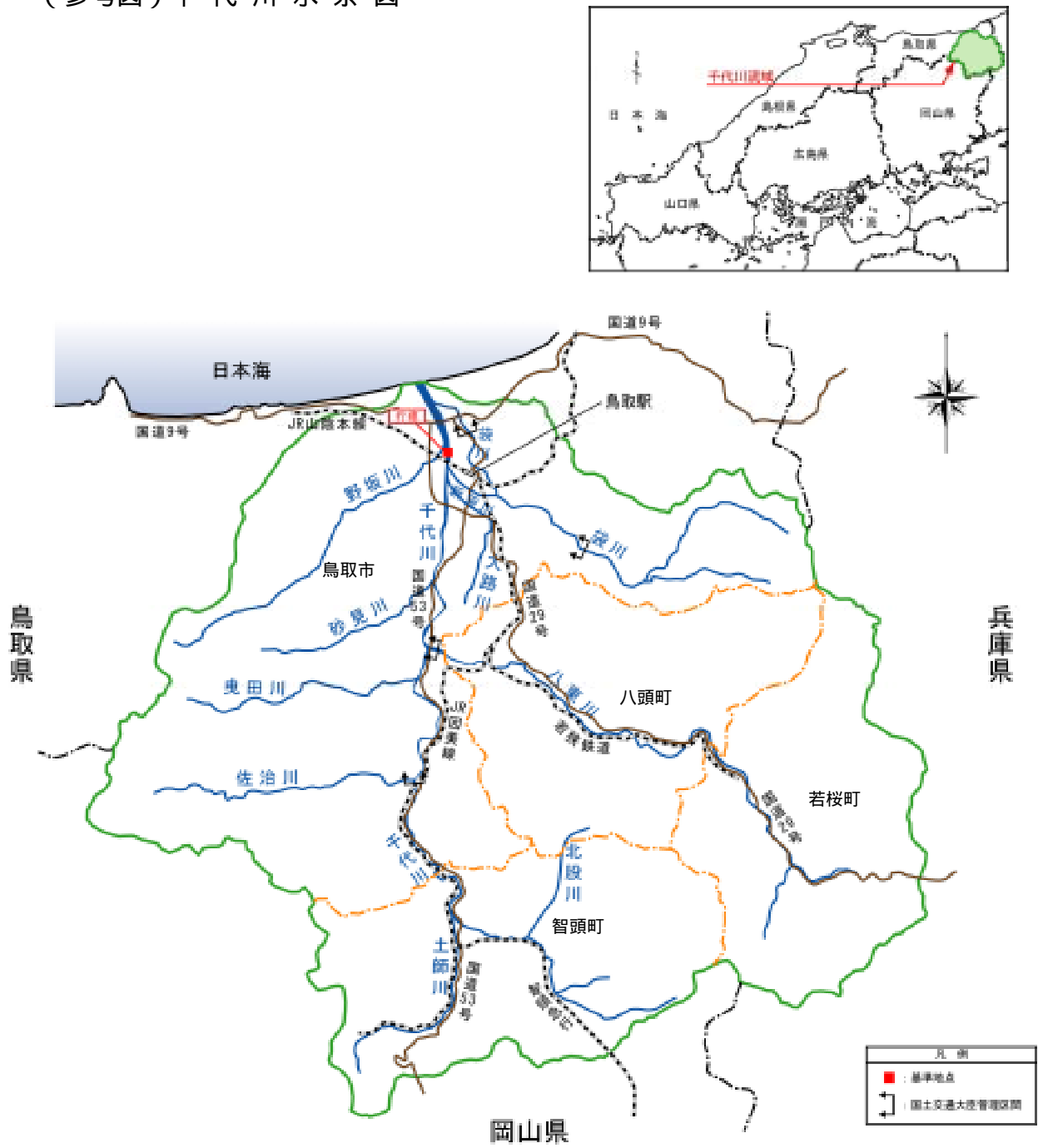
(参考図) 千代川水系図