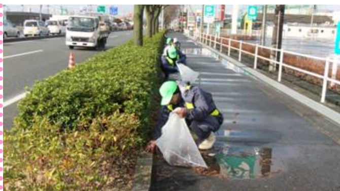
～ 落ち葉の除去作業 ～ 植樹帯の中まできれいに除去しました！