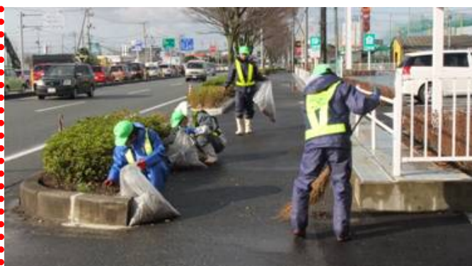
～ 植樹帯の草取り、歩道清掃 ～ 手作業で丁寧にを行いました