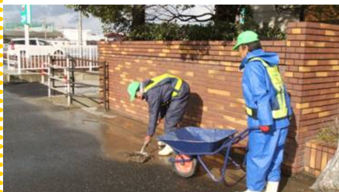
～ 小石や泥の除去 ～ スコップを使い、残さず除去！