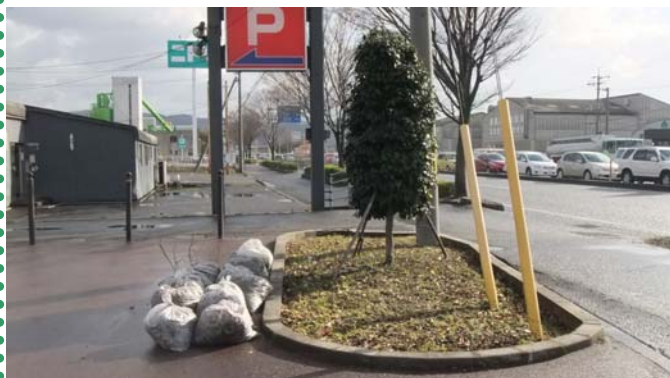
～ 植樹帯整備後 ～ 除草した結果、きれいになりました！