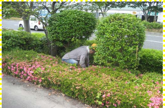
～ 「植樹帯」の整備作業中～ 細かな部分も手作業でキレイに除去！！