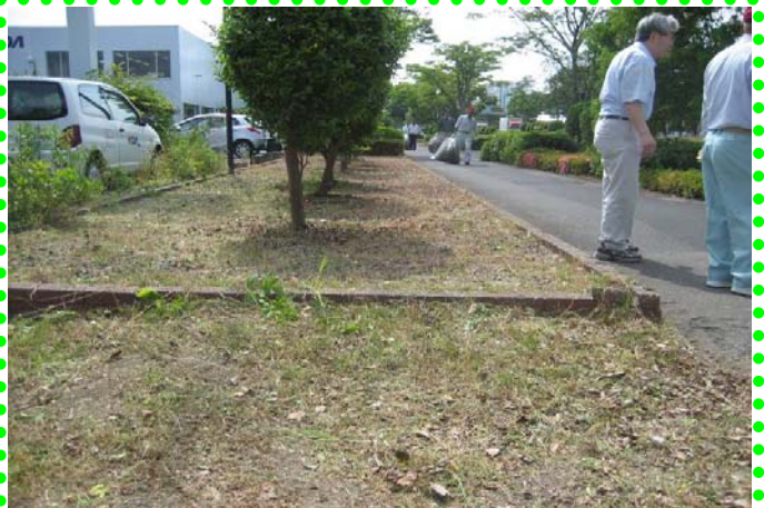
～ 清掃後の風景～ 除草の結果、植樹周辺がスッキリ！！