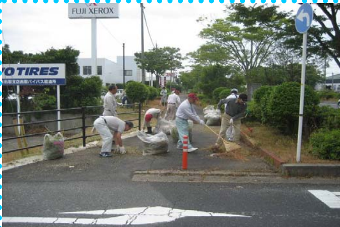
～ 活動開始！！～ みるみるうちに一帯がキレイに♪♪