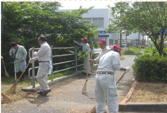
～ 仕上げに歩道を掃除～ 歩道にはみ出した枝も除去しました。