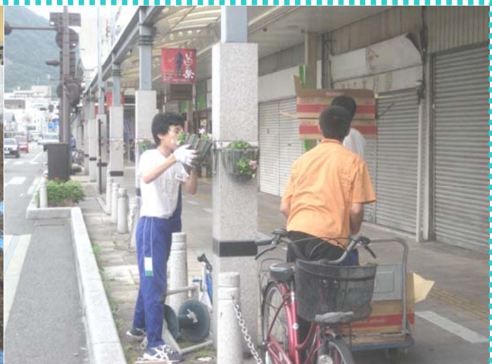
～北中学校2年生の皆さんが支柱の花の植え替え及び土作りをしました♪♪～