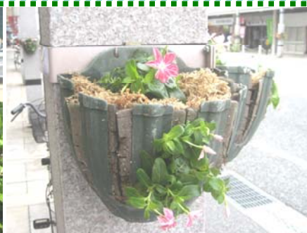
支柱の日々草ピアンカ