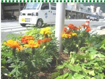
花壇のマリーゴールド