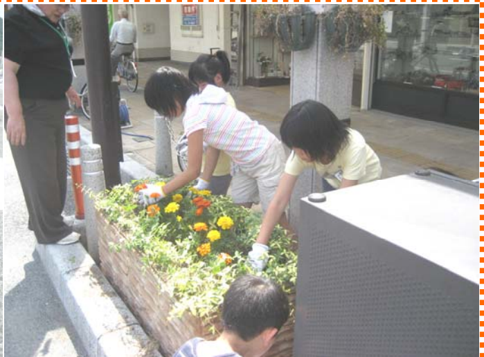
～遷喬小学校3,4年生の皆さんが手際よく花の植え替えを行いました！！～