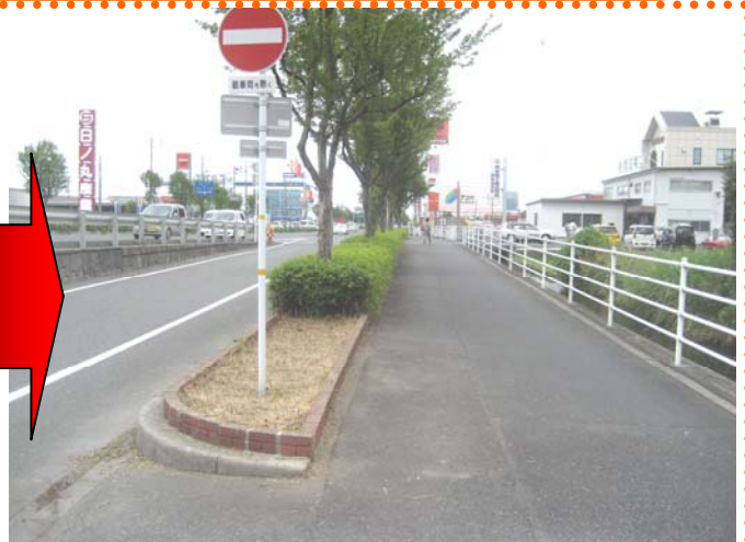
～視界が良好になりました♪♪～