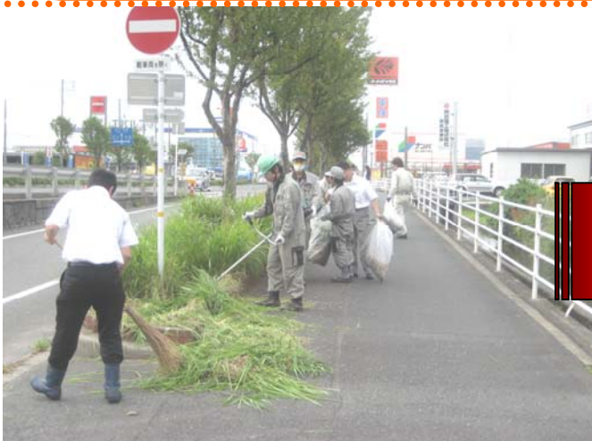
～総勢15名で作業開始！！～