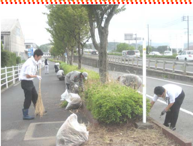
～細かい所は手作業で入念に行いました～