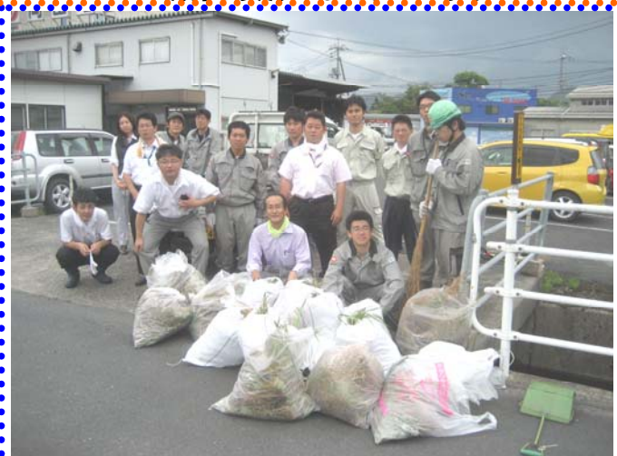
～活動後の集合写真♪～