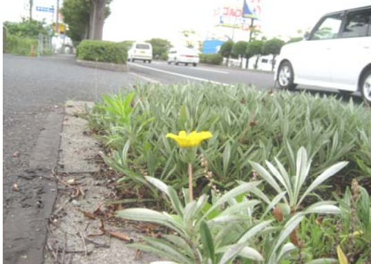
花壇にはガザニアクイーンが根付いています♪

これからもこの道を利用する方々がさわやかな気分になっていただけるよう、活動を続けて行きたいと思えます。