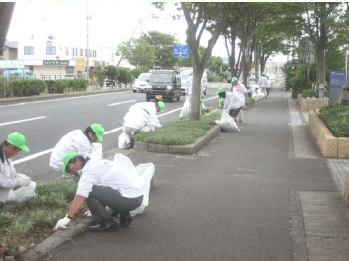
～ 花壇の除草を一齐に開始！！ ～