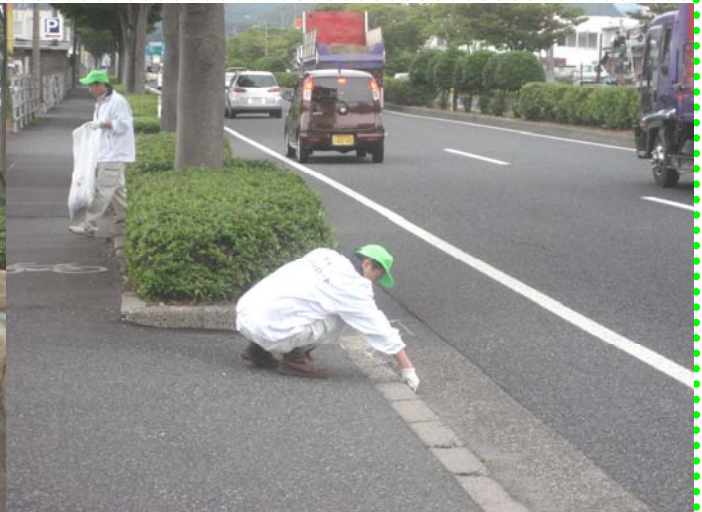
～ 細かな部分も綺麗に♪♪ ～