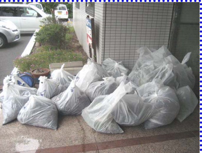
～ 30分の間に26袋もゴミが・・・ ～