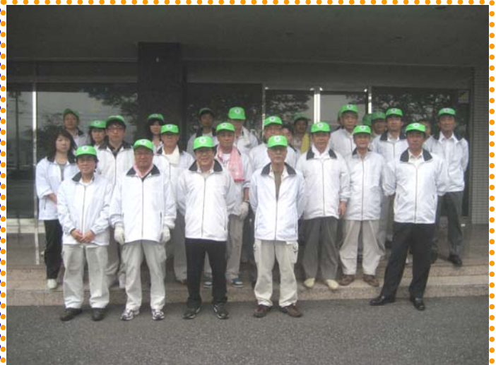
～ 作業後にみんなで一枚 ～