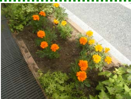
今回はマリーゴールド160株を植えました