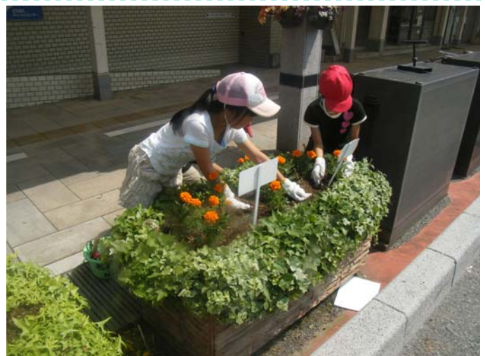
～商店街の方達のアドバイスもあり、植え替えは作業は40分程で完了～