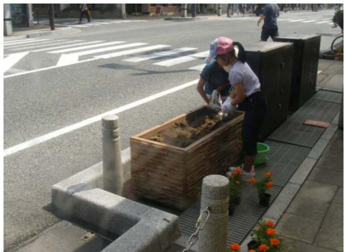
～遷喬小学校3,4年生の皆さんがワイワイと楽しく花の植え替えを行いました♪～