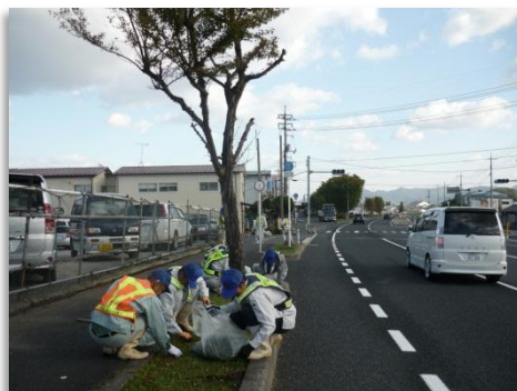
やっぱり手作業が命！