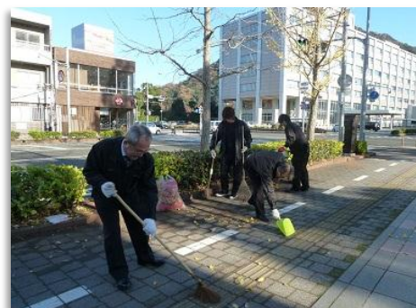
落ち葉シーズンの終盤戦。地道に、丁寧に集めていきます！