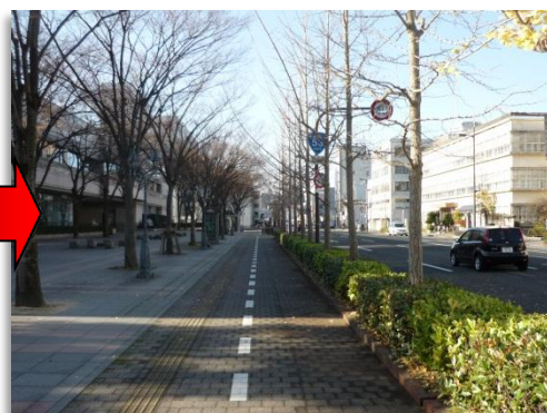
活動した人も歩く人も、すがすがしい気分！