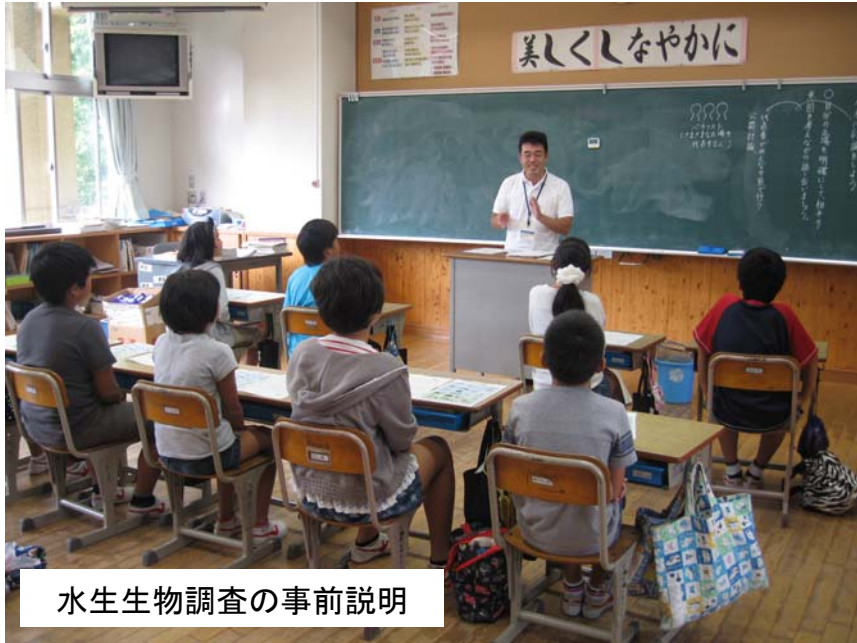
水生生物調査の事前説明