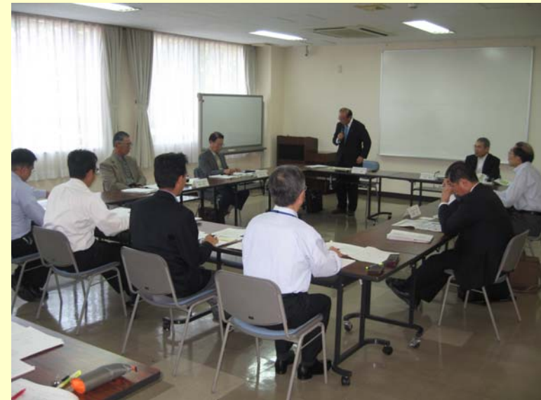
第1回千代川河川アドバイザー会議の様相