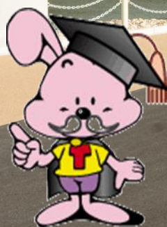
とのまる君 殿ダムイメージキャラクター

殿ダムはどんな役割をするの？水はどこから流れるの？ダムを見学しながら皆様の疑問にお答えします。