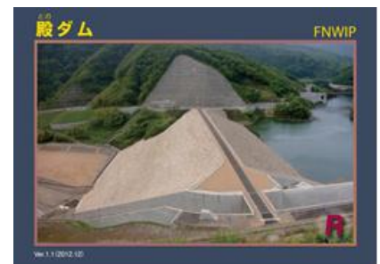
現ダムカードの写真