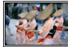
越中八尾おわら風の盆