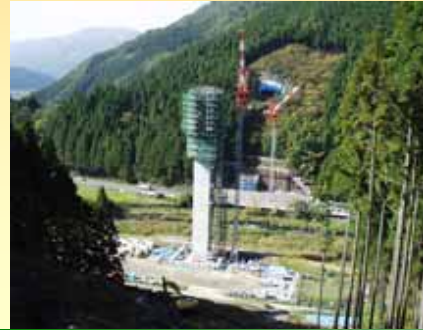
建設中の志戸坂峠道路