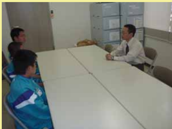
概要説明：出張所はこんな仕事をしています

雨が心配されていましたが、幸いにも3日間雨は降らず、3名の生徒は、郡家維持出張所の行っている業務を現地で体験されました。