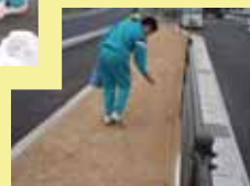
VSP 体験：クローバーの種をまきました