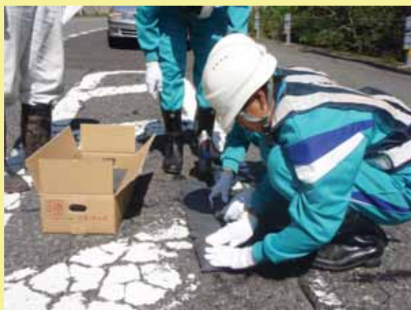
道路の補修：アスファルト合材での簡易補修