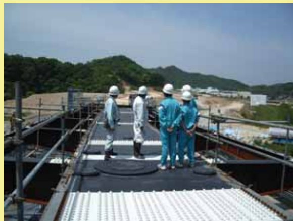
工事現場見学：姫鳥線の現地を見に行きました