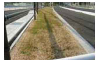
15月末に種をまいた 中央中学校前のクローバー (H21. 6. 23撮影)

野外活動では雨は望みませんでしたが、八東中学生のまいたクローバーが成長するには、適量の雨が必要です。今は「少しは雨が降って欲しい」という心境です。