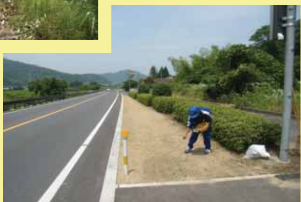
↑クローバーの種をまく