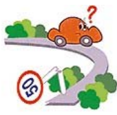
標識が壊れて見にくい