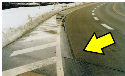
グルーピング工法施行後の写真(イメージ)

当出張所では、冬場になると国道29号及び国道53号の交通確保のため、道路除雪作業を行っています。 除雪後に路肩に溜まった雪からの雪解け水が道路路面に流入することを防止するものとして、グルーピング工法を行っている箇所があります。この対策により、路面に水が流入することを防ぎ、凍結を防止することができます。