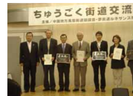
夢街道ルネサンスの新しい団体のみなさん