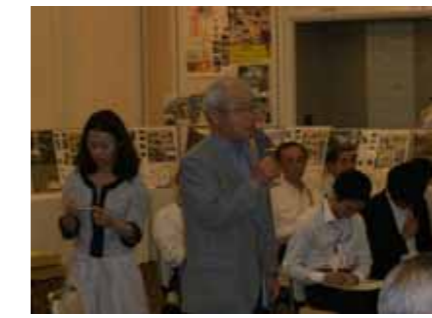
活発な意見交換が行われました