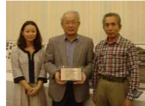
昨年「手作り郷土賞」を受賞した 岩国往来まちづくり協議会のみなさん