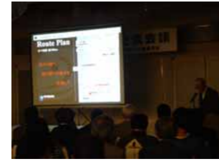
活動内容 & 新しい取り組みの紹介