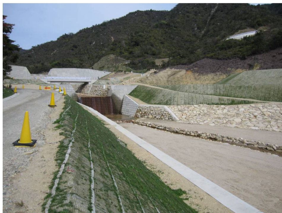
▲剣川砂防工事(防府市)