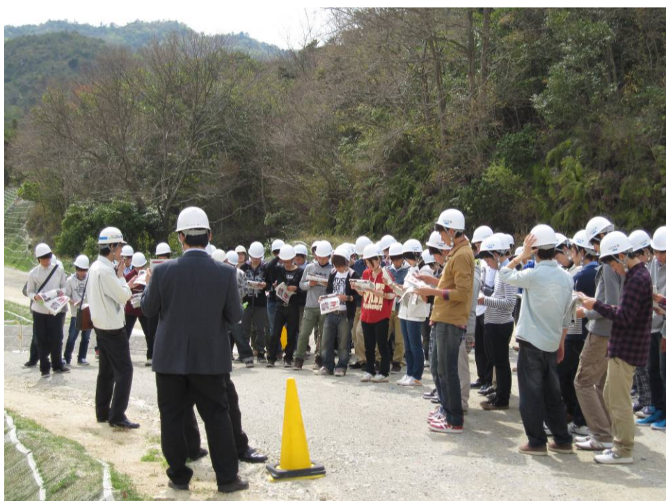
▲剣川砂防工事現場(防府市)

山口大学工学部社会建設工学科1年生 約80名が、国土交通省山口河川国道事務所で見学しました。