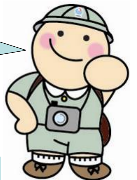
事務所キャラクター まもるくん