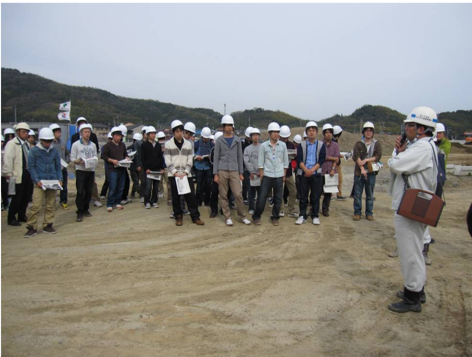
▲周南市西部「道の駅」(仮称)工事現場

山口大学社会建設工学科新入生に、社会資本整備の重要性や、土木業界・建設行政の魅力をして頂き、入学後の学習意欲向上を目的に、土木業界や建設行政について説明しました。また、山口河川国道事務所で見学した、平成21年7月の中国・九州北部豪雨で山口県防府市を中心に発生した土石流の対策を目的とした剣川砂防工事、交通渋滞の緩和を目的とした戸田拡幅事業、周南市西部「道の駅」(仮称)の現場見学をおこないました。