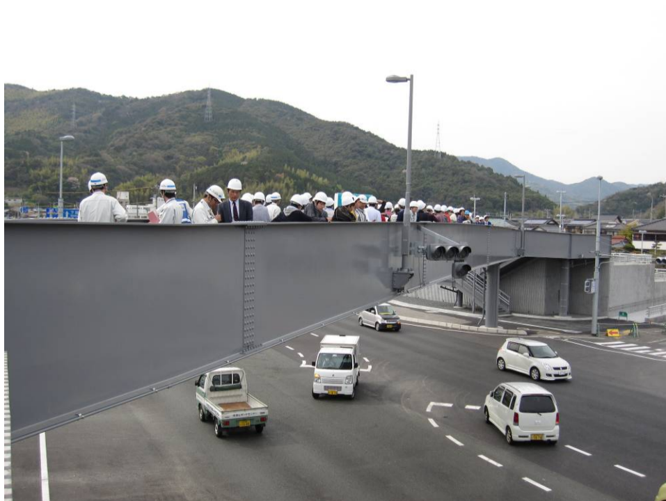
▲戸田拡幅事業(周南市)